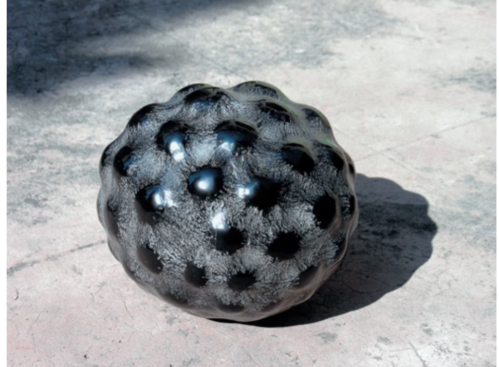
Notte di San Lorenzo, 2006, Marmor Nero del Belgio, 15 x 16 x 16 cm.