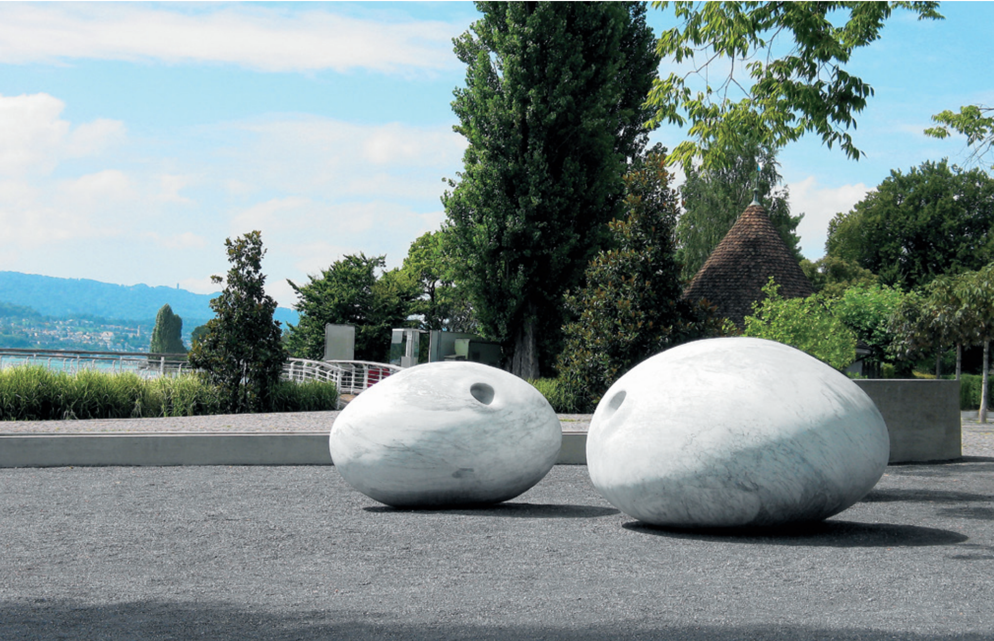
Daydream, 2006 Marmor ordinario (l) 100 x 120 x 160 cm (r) 120 x 160 x 200 cm Seeanlage Meilen.