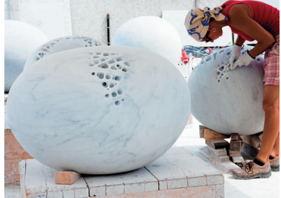
Sibylle Pasche auf dem Werkplatz in Carrara.

Selbständig, ohne Hilfe von Assistenten, bearbeitet Sibylle Pasche den Marmor, ihren bevorzugten Werkstoff, dessen Namen sie, internationaler Konvention folgend, stets in italienischer Sprache notiert. Eigenhändig glättet sie die Oberflächen, raut diese aber auch auf oder öffnet sie, um das Innere des Steins und dessen im Prinzip unsichtbare Strukturen freizulegen. Zu Hilfe kommen ihr dabei neben modernen Schleifmaschinen das in Carrara vermittelte, traditionsreiche handwerkliche Können mit Hammer und Meissel.