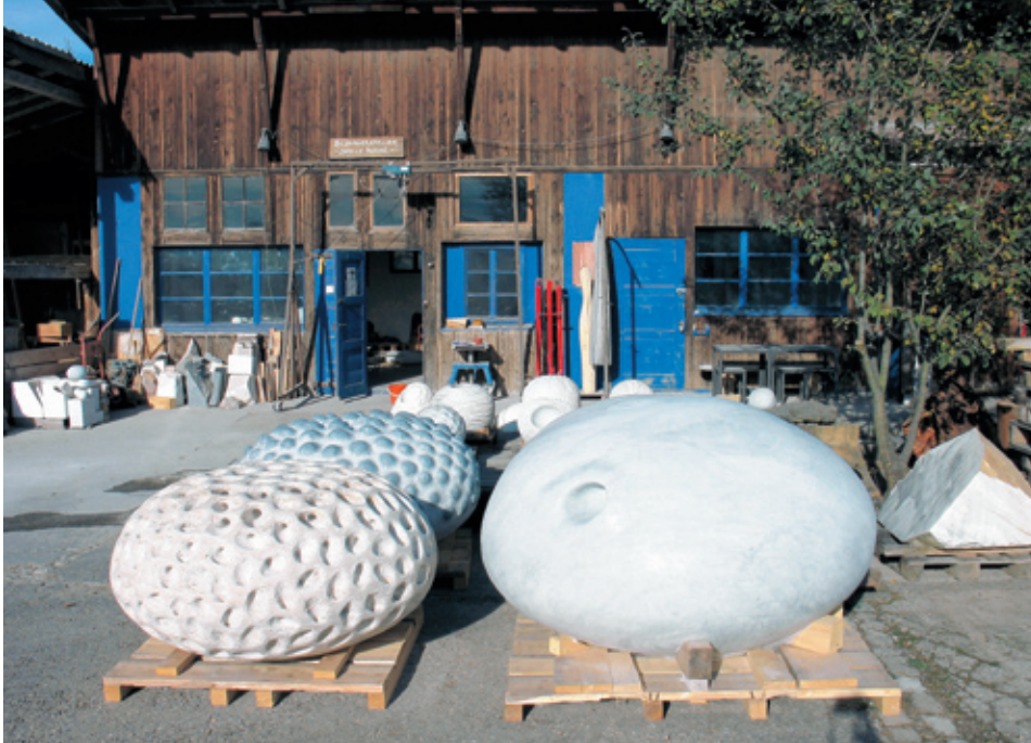
Werkplatz Burg, Meilen.

Sibylle Pasches Arbeitsort auf der «Burg» kennen viele Meilemer bereits von Spaziergängen. Im Sommer 2008 erhielt sie nach längeren, intensiven Bemühungen die Erlaubnis der Gemeinde Meilen, eine Auswahl ihrer Skulpturen unter dem Titel «Grosse Volumen» in der Seeanlage bei der Fährstation zu präsentieren. Dies bot Gelegenheit, mit ihren Arbeiten auch eine breitere Öffentlichkeit zu erreichen.