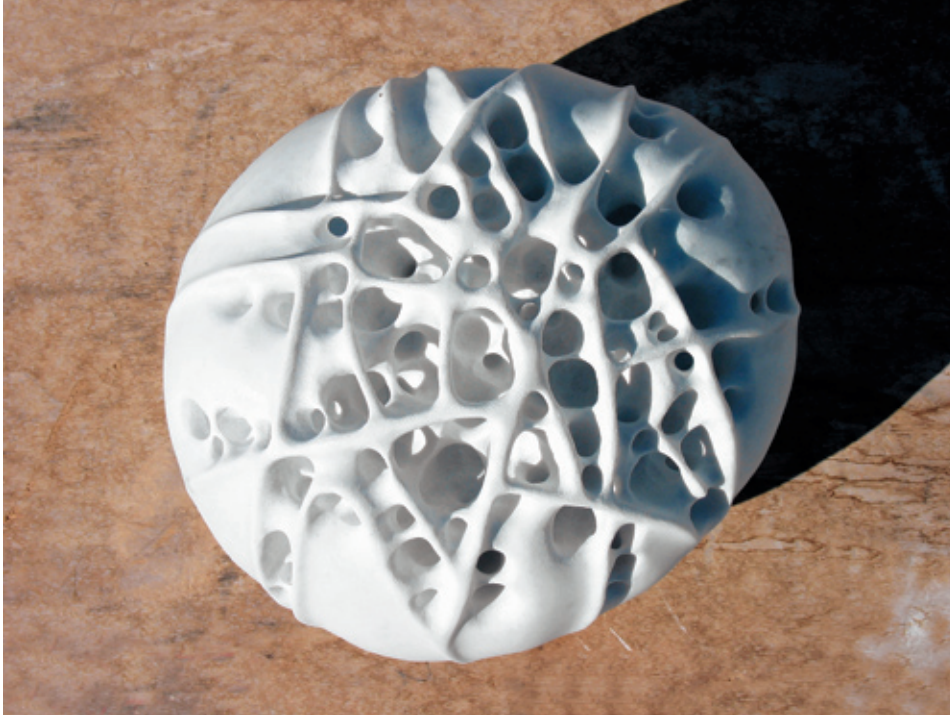
Cosa sarà, 2007, Marmor Bianco Carrara, 23 x 29 x 32 cm.

In «Cosa sarà» und «Notte di San Lorenzo» zeigt sich das Motiv des Aufbrechens der Oberfläche in gegenläufiger Weise ganz exemplarisch: Im Spiel von «konvex – nach innen / konkav – nach aussen» ist der Stein nach innen geöffnet, oder er stülpt sich in den umgebenden Raum aus. In «Cosa sarà» offenbart so der weisse Marmor sein wie von zarten Stegen durchzogenes Inneres. Die zerbrechlichen Strukturen erinnern sowohl an das filigrane Linienspiel der Zeichnungen als auch an freigelegte Nervenbahnen.